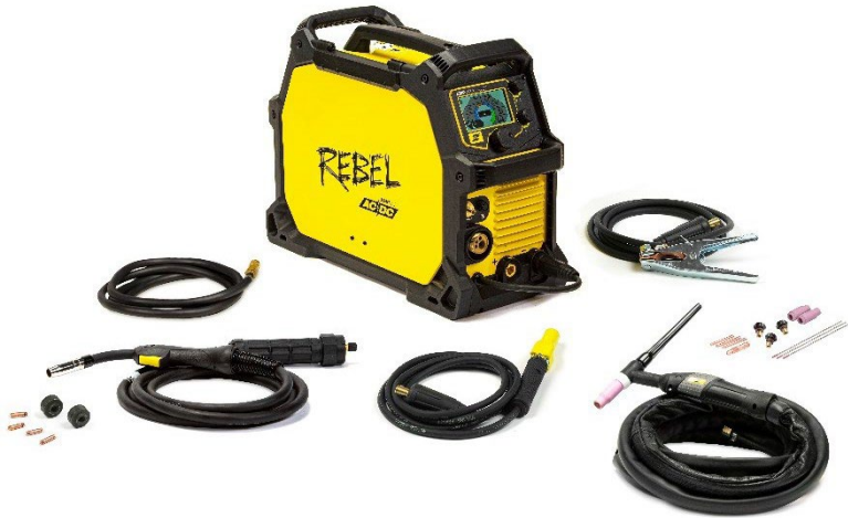
Rebel EMP 205ic AC/DC y accesorios.

Hicimos posible lo imposible con la primera máquina portátil para todos los procesos, completa con capacidades MIG, núcleo de fundente, MMA, TIG en CC y ahora TIG en CA, lo que significa que sí, puede soldar aluminio con TIG. Es un VERDADERO sistema de soldadura todo en uno que ofrece el mejor rendimiento de su clase en cada proceso, en el paquete industrial más portátil y duradero, que se puede llevar a cualquier parte y soldar cualquier cosa en el mercado actual.